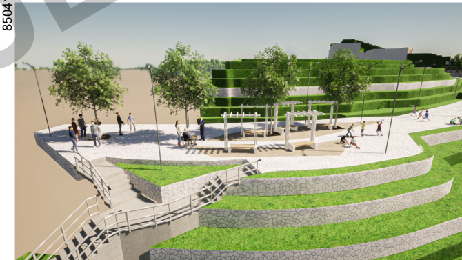
ESPACIO PUBLICO VECINAL